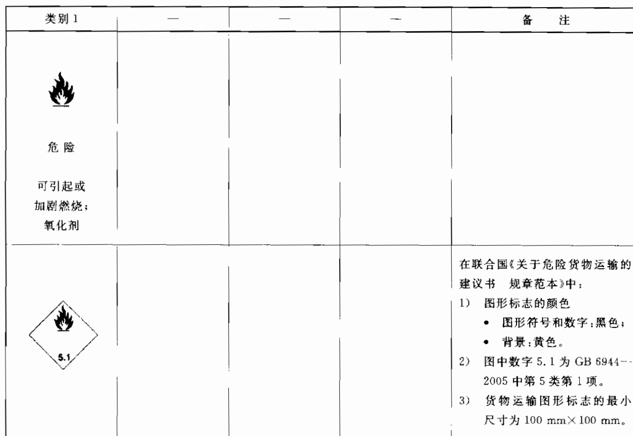
表 3 氧化性气体类别和标签要素的配置